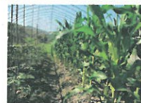
野菜畑にいっぱい 四季折々の旬のお野菜たち♪