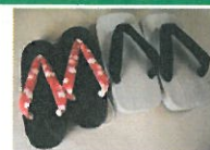
もちろん男性用の桐下駄も！ 大好きな人とペア桐下駄、 なんて、なんだかオシャレ♪

※問い合わせ先 山西商店 tel(087)894-0306 2週間前までに要申込み 5～15名まで受け入れ可能 体験料1,500円～