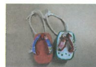
幸せを運ぶお守りミニ下駄☆ こんなに可愛い貴方だけの お守りまで作れちゃう！