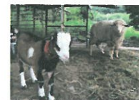
可愛い小動物たちもお出迎え ニワトリの鳴き声で目覚める 朝なんてステキ