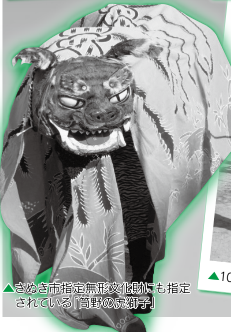
▲さぬき市指定無形文化財にも指定されている「筒野の虎獅子」