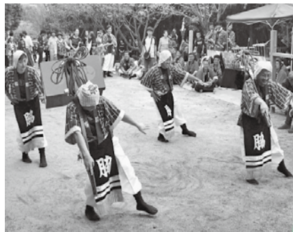
▲9/23.24 男山神社 秋季例大祭