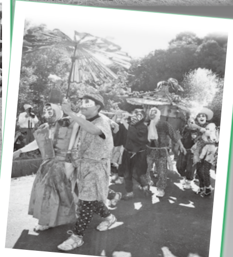
▲10/8 塚原稻荷神社 あばれみこし