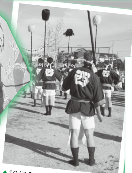
▲10/7.8 産宮神社 秋祭