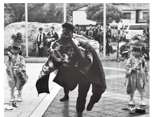
▲10/8 多和神社 秋季大祭