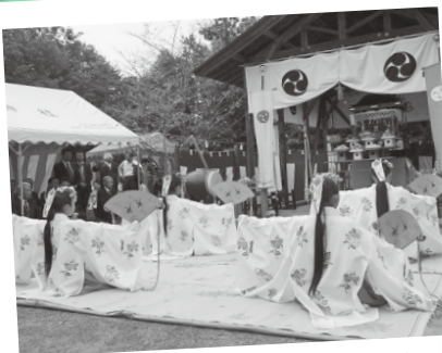
▲9/22.23 造田神社 秋季例大祭