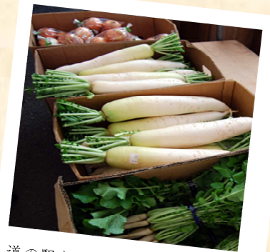
道の駅などでは新鮮野菜が揃う