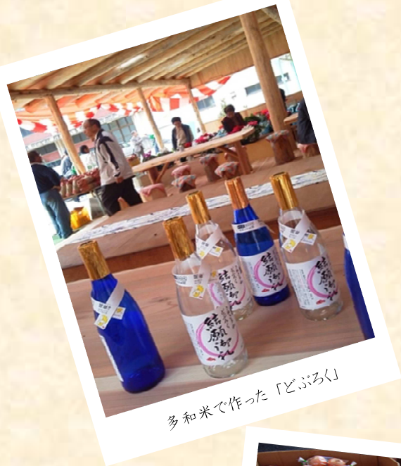
多和米で作った「どぶろく」