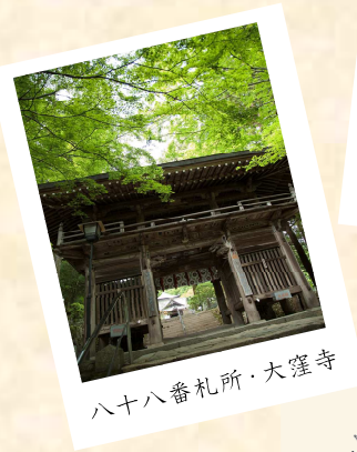
八十八番札所・大窪寺