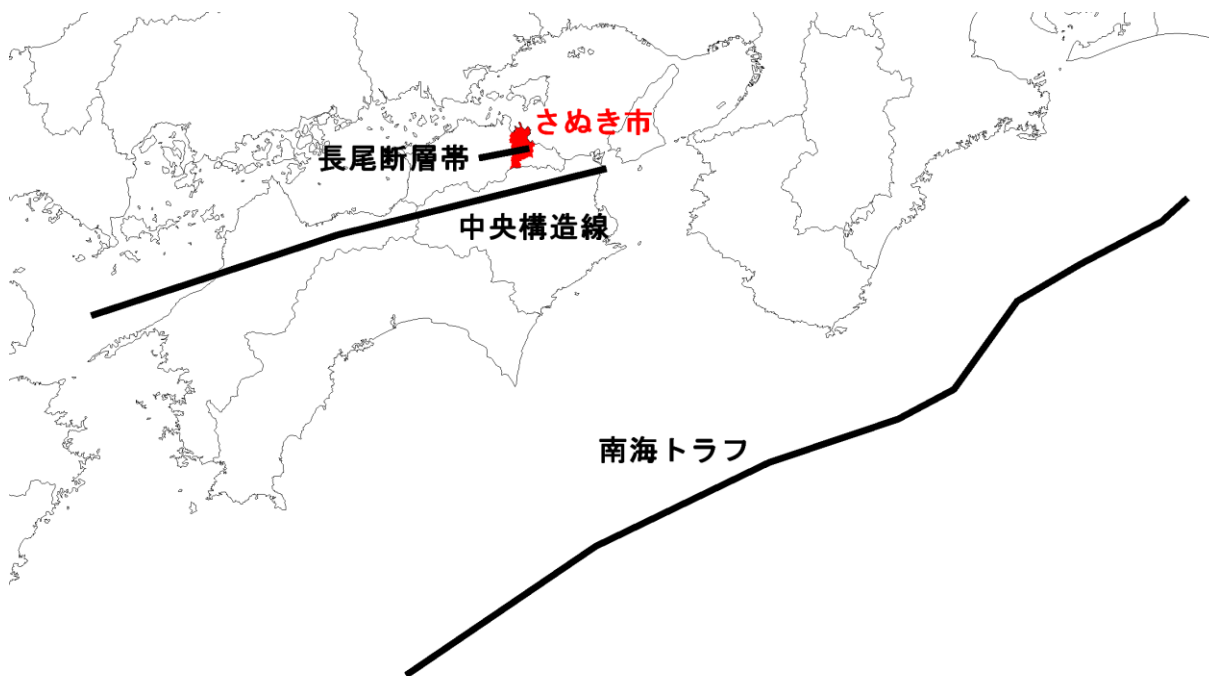
想定地震の震源位置図