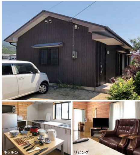
キッチン リビング