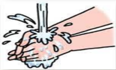
石鹸と流水による手洗い