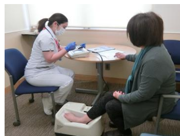
■骨密度測定の様子