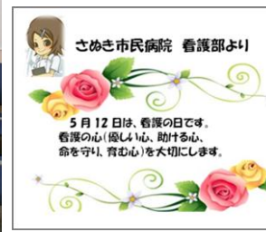
■手作りのメッセージカード