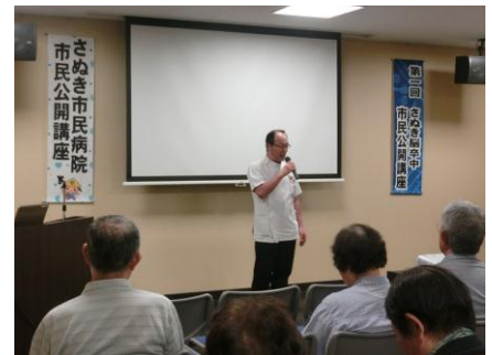
■笹岡医師による講演の様子

今後も、市民の方が住み慣れた地域でより長く生活していけるようサポートして参ります。