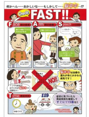
■脳卒中 症状に気づいたらすぐに119番!!

5月9日(木)から10日(金)にかけて1階エントランスホールにて、看護部体験学習委員会が主となり「看護の日」のイベントを行いました。この活動は看護師の専門的知識と技術を活用し、健康、保健指導に関する支援活動を行うことを目的に毎年行っています。今年度は「ロコモ」をメインテーマとし血管年齢・骨密度測定・握力測定などを行い「薬剤師の相談コーナー」「健康相談コーナー」を設け2日間で53名の方にお越しいただきました。骨密度測定は希望者が多く「骨密度が心配だったが測ってよかった」など測定値を見ながら健康相談を行いました。また入院患者さんには手作りのメッセージカードを手渡しました。