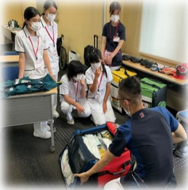
バイタルサイン測定