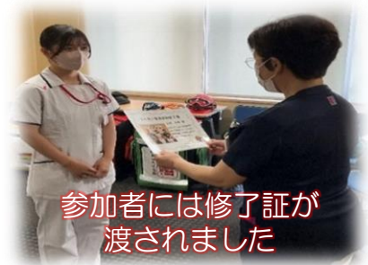
参加者には修了証が 渡されました