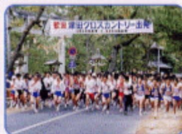
津田クロスカントリー