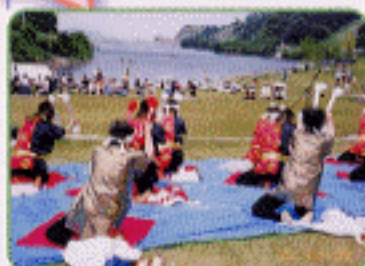
門入の郷山上公園祭り