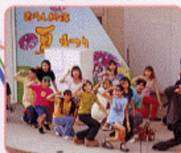
みろく自然公園納涼夏まつり