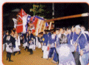
多和神社(秋の大祭)