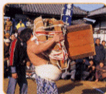
長尾寺大会(力餅運搬競技)