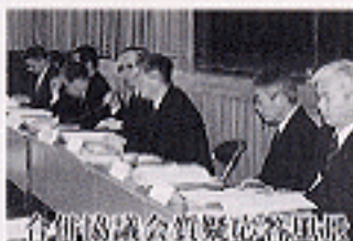
合併協議会質疑応答集