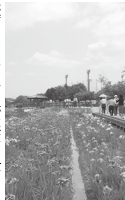
バザーなどのテントが並び、イベントを盛り上げていました。

地元の「花しょうぶを愛でる会」会員の手に大切に育てられた約15万本、250種の花ショウブが見ごろを迎えた亀鶴公園で、さぬき市長尾第24回ショウブまつりが開かれました。この日は、愛媛県からのツアー客が訪れるなど、県内外からの来園者でにぎわいました。会場周辺では、竹細工教室や竹ソーメンの