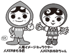
人権イメージキャラクター AKENまもる君 AKENあゆみちゃん