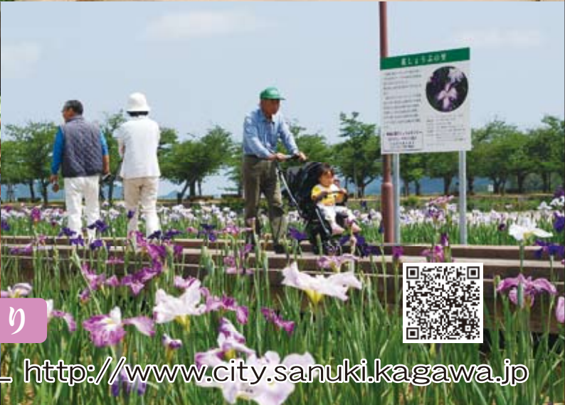
さぬき市長尾第24回ショウブまつり