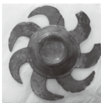
▲「森広遺跡」から発見された「巴形銅器」

○歴史民俗資料館企画展 夏休み中開催 (休館日：水曜日) 開館時間：9時～17時 入館料：一般100円、小学生50円 夏休みの自由研究などで困っている小中学生の皆さん、ぜひこれらの施設を見学してみてください。ようか。 生涯学習課 ☎(0879)42-3107