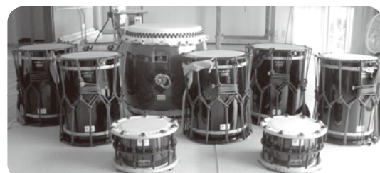
(南川阿讃峡太鼓保存会)