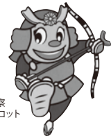
香川県警察 シンボルマスコット ヨイチ

するなど水難事故防止に努めましょう。また、「いつ・どこで・誰と」を必ず子どもから聞いておくことも重要です。