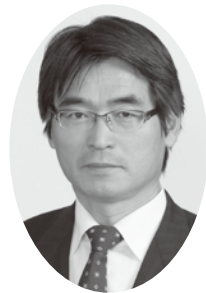
さぬき市議会議長