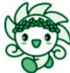
人権かがやきくん