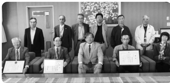
第3位 平畑喜楽会 (津田地区) 第4位 大川Aチーム (大川地区) 第7位 志度Aチーム (志度地区)