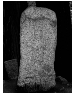
大窪寺の庚申塔 1874年