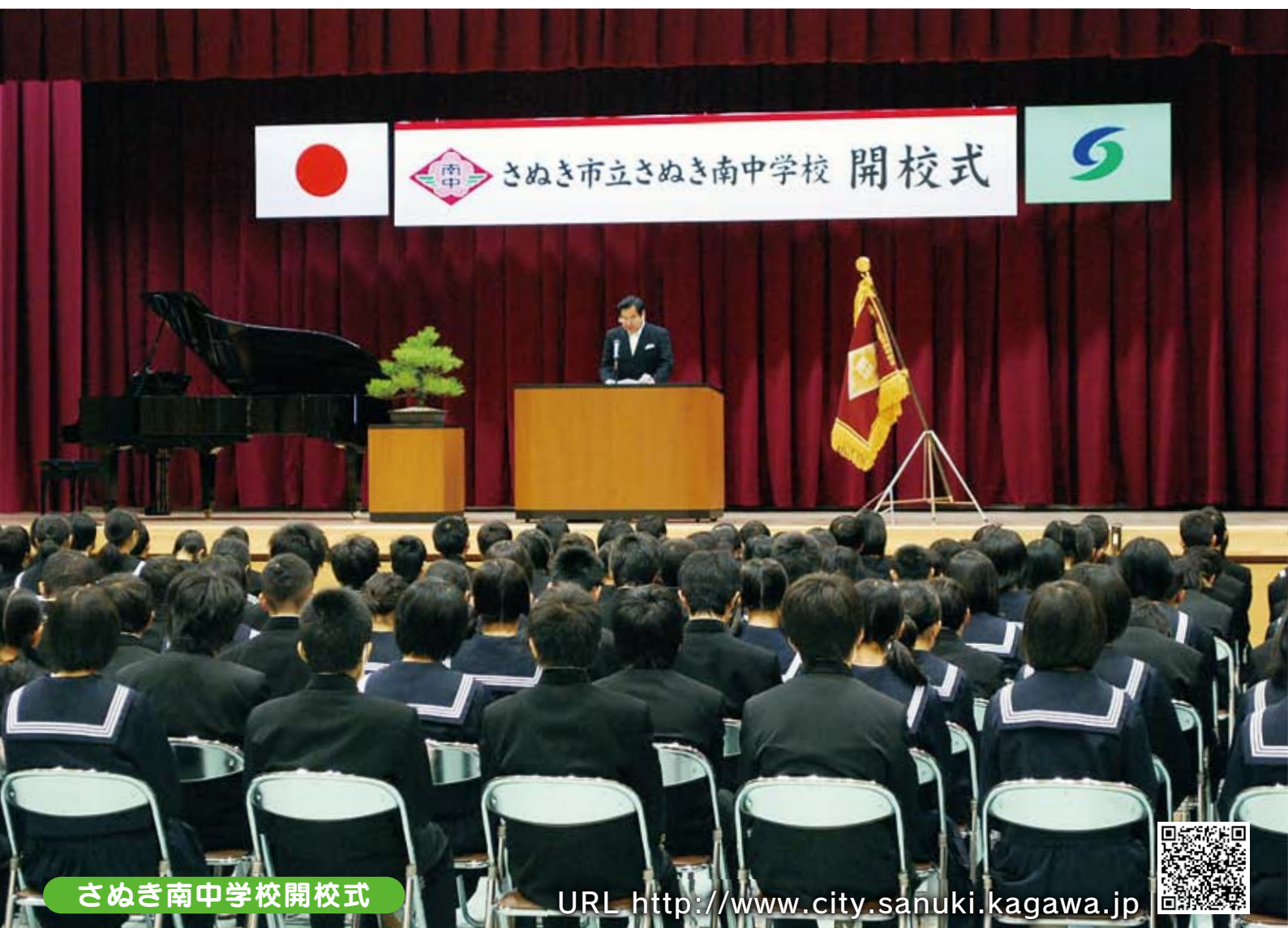
さぬき南中学校開校式