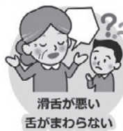
滑舌が悪い 舌がまわらない