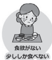
食欲がない 少ししか食べない