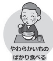
やわらかいもの ばかり食べる