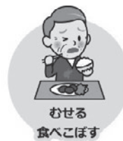
むせる 食べこぼす