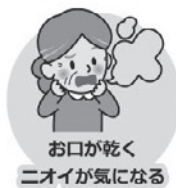
お口が乾く ニオイが気になる