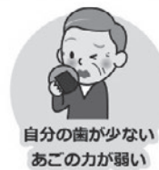
自分の歯が少ない あごの力が弱い