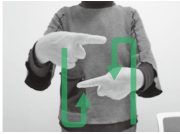
▲「手話」を表す手話です

手話をコミュニケーション手段として利用する方が福祉事務所を利用する際等の手助けをするため、定期的到手話通訳者を設置しています。手話を必要としている方についての相談や手話に関するお話も受け付けていますので、気軽にご利用ください。