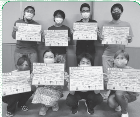
さぬき市観光地域づくり懇談会メンバーと香川大学の学生たち

「普段気にせず通っている道には沢山のオモシロイが詰まっています！」と笑顔でお話してくださいました。あなただけのおもしろポイントが見つかるかもしれません♪