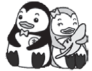
更生保護のマスコットキャラクター 「更生ペンギンのホゴちゃん」とサラちゃん」