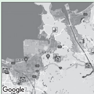
ハザードマップ各種