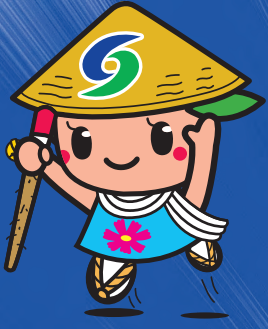
さぬき市マスコットキャラクター 「さっきー」