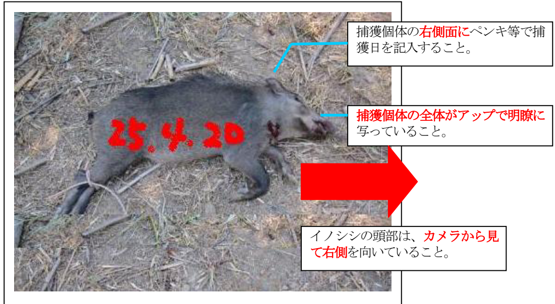
(体の大きさ、特徴がわかるものとする)