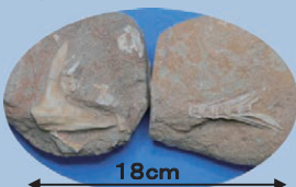
18cm (アゴ+歯) (尾)