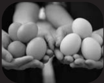
卵、だし巻き卵、 たまごプリン