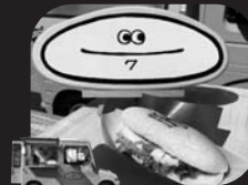
コッペパンサンド、 あげコッペ