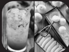
桃ソーダ、桃アイス、 ホットジュース、マシュマロ