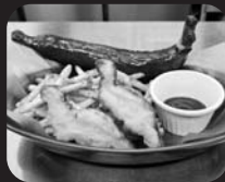
お弁当、 フライドポテト、スープ他