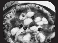
マルゲリータピザ、 さぬきの夢ビスコッティ

【出店者一覧】かなたまキッチン、飯田桃園、長田幸福堂、Schleich CAFE、KLATCH COFFEE TAKAMATSU、ナナブンノハチくち〜な、Real cre'er、八十二薫堂、こんちゃん農園 ※出店店舗、販売品目は予定となります。変更となる場合もございますのでご了承ください。 ※マルシェはテイクアウトマルシェとし、お酒の販売はございません。また飲食スペースの設置はございませんので、公園内での飲食については三密を避けソーシャルディスタンスの確保をお願い致します。会場へご入場の際は必ず検温及び消毒をお願い致します。チェック済の方には会場内専用カラーバンドを各入口にてお渡し致します。