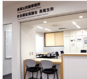
【長尾公民館事務所】