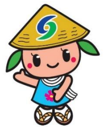
マスクットキャラクター 「さっきー」