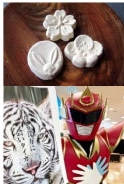
東かがわ市 和三盆 ご当地ヒーロー「てぶくろマン」