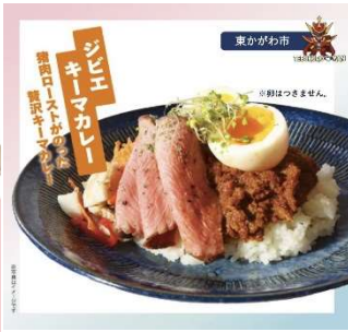
東かがわ市 ジビエカレー