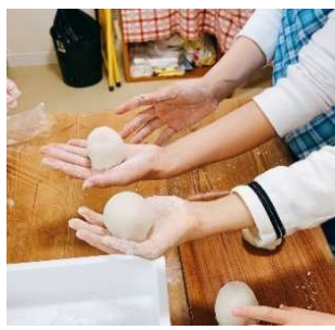
三木町ワークショップ いちご大福づくり