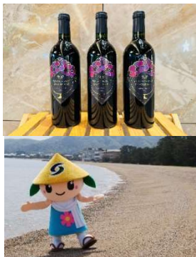
さぬき市 さぬきワイナリーワイン 公式マスコット「さっきー」