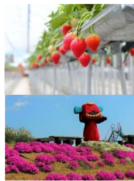
三木町 いちご PR キャラクター「舞ちゃん」