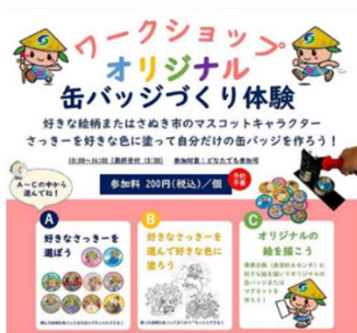
さぬき市ワークショップ オリジナル缶バッチづくり