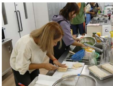
↑昨年度の事業の様子 （日本・アジアのおやつ作りとお里自慢交流会）