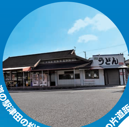
道の駅津田の松原でレンタル