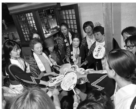
↑8月17日に地域の皆さんと津田おどりを踊りました

休止中の行事もありますが、各保存会等の皆さんの御尽力で、その伝統に触れることができるので、私も是非経験したいです。